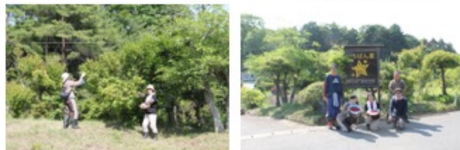
綺麗になったいちばん星の看板前で記念写真＝6月16日

月に一度、南相馬に支援において下さっている八王子市の武蔵野会の皆様（総勢20名）が6月18日（火）、うち3名の男性の方には、いちばん星施設内の看板・畑周りの草刈りや剪定作業、剪定後の枝・雑草などの片づけ作業を、女性の方2名には「すぐりの実」の収穫作業をお手伝いいただきました。お陰様で作業していただいた箇所はスッキリと見栄えの良い綺麗な状態となり、畑の日当たりも良く、何より景観が良くなる事でお越しくださるお客様も気持ちよくお迎えする事ができます。武蔵野会の皆様には心から感謝、致します。本当にありがとうございました。