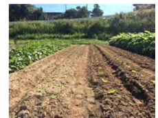
じゃがいもの後に 植え付けた大根