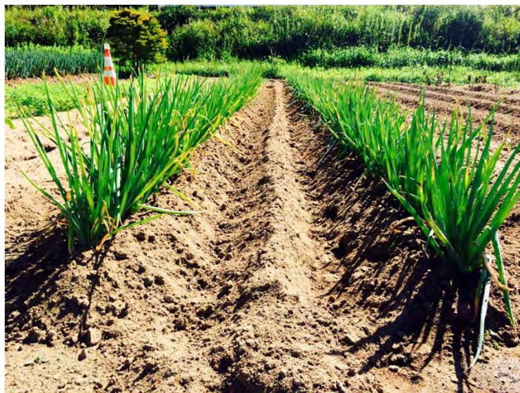
今回の旬直便でお届けする「長ネギ」の様子

長ネギが収穫の時期を迎えました。様々なお料理で活躍する新鮮な「長ネギ」を今回の「旬・直・おすすり便」でお届けします。 先月、お届けした「北あかり」（じゃがいも）の後に、大根の植え付けをしました。 収穫の時期を迎えたら、皆様には、お届けいたます。 「さつまいも」もまもなく収穫の時期を迎えます。